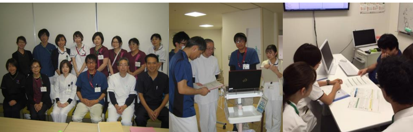
多職種からなる糖尿病チームメンバー 多職種参加型の糖尿病チーム回診 糖尿病チーム外来カンファレンス

糖尿病内科では、糖尿病性昏睡で緊急入院した症例、血糖コントロールが困難な症例、合併症の進んだ症例、肺炎・尿路感染症・脳血管障害などの疾患を合併した糖尿病症例などの治療を行っています。