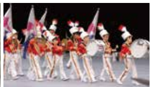
なかよし子ども園 ぞう組 マーチングバンド