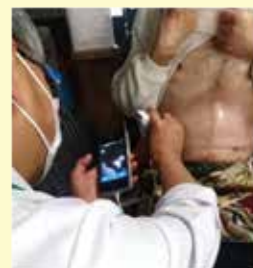
在宅診療での実際の様子

小さくなった超音波医療装置 のこと。主に腹水や胸水、内臓の動きや尿の貯留状態などが検査でき、血管の状態も解かります。持ち運び可能で場所を選ばず使えるのが強みで、在宅での緊急な診断にも有効です。